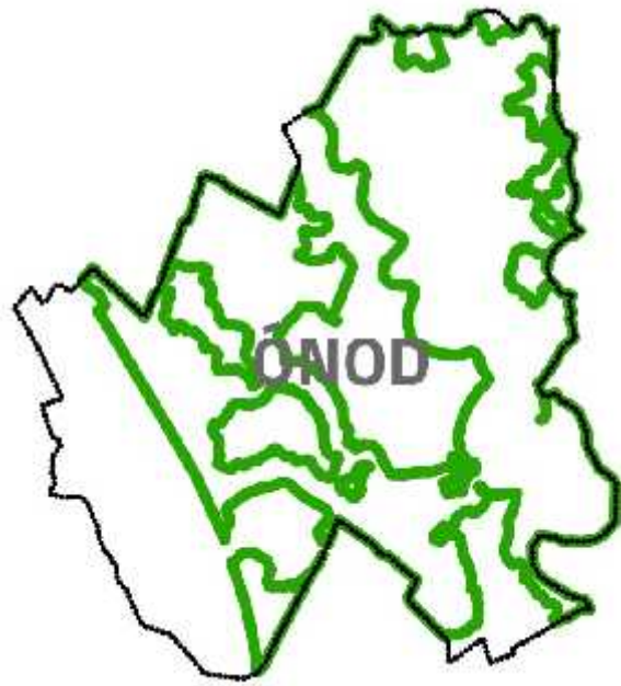
Nagyvízi mederkezelési tervek kijelölt szakaszai

A rendkívüli árvizek történetében példátlan gyorsasággal egymást követ és a korábbi vízszintmagasságokat rendre meghaladó árvizek 1998-2013 között azt bizonyítják, hogy az árvízvédekezés hagyományos eszközei kimerültek. A sikeres védekezés esélyének meg rzéséhez új eszközöket is keresni kell, els sorban a megelőzés területén. Különösen jelent s, hogy a medrekben elhelyezked építmények, elvadult szántók, erd k aljnövényzetének elburjánzása stb. korlátozzák a folyó természetes életterét. Ezt igazolja, hogy míg az árvízi vízhozamok nem n nek, a vízállások er sen emelkednek. A folyók felé terjeszked települések nem csak rontják az árvíz levezetését, hanem ezeknek a településrészeknek a megvédése árvíz idején rendkívüli er feszítést, esetenként a védett értéket messze meghaladó ráfordítást igényel. Gátat kell tehát vetni a folyók vízszállító képességét csökkent , duzzasztást okozó tevékenységeknek. Helyre kell állítani, illetve javítani kell az árvízi hozamok levezetését.