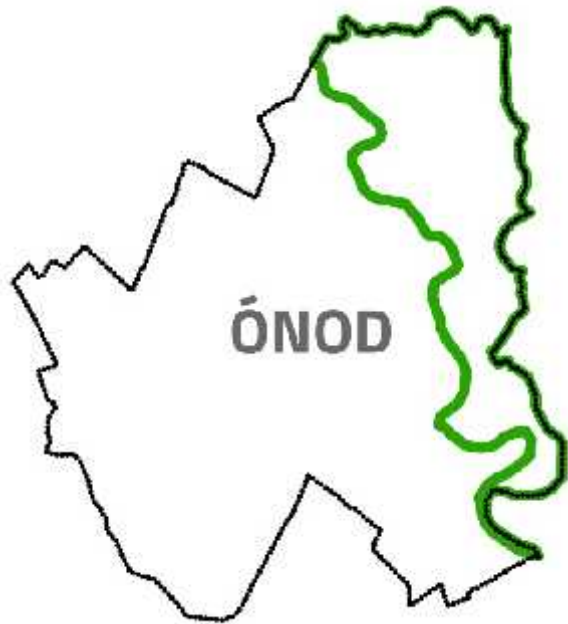
Aggteleki Nemzeti Park Igazgatóság működési területe

A korábban a Bükk Nemzeti Park Igazgatóság működési területén lévő, egyedi jogszabállyal védett nyilvántartott országos jelentőségű védett természetek közül a Tokaj-Bodrogszegi Tájvédelmi Körzet, a Zempléni Tájvédelmi Körzet, továbbá a Bodrogszegi Várhegy Természetvédelmi Terület, az Erdényi-félsziget Természetvédelmi Terület, a Füzéradványi park Természetvédelmi Terület, a Long-erd Természetvédelmi Terület, a Megyaszói-tátorjános Természetvédelmi Terület, a Megyer-hegyi Tengerezem Természetvédelmi Terület, a Sóstói-félsziget Természetvédelmi Terület és a Tállyai Patócs-hegy Természetvédelmi Terület az Aggteleki Nemzeti Park működési területére került át.